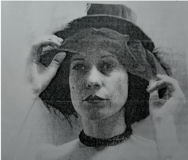
С. Бень

У зале ўсё гэта Вы зывае смех, пры тым што са сцэны зноў-такі бсалютнобесстрастно